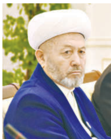
Усмонхон АЛИМОВ, Ўзбекистон мусулмонлари идораси раиси, муфтий

Бисмиллаҳир Роҳманир Роҳим. Бугун тарихий даврнинг янги босқичи — халқимиз ўз олдига эзгу мақсадлар қўйиб, ўз куч ва имкониятларига таянган ҳолда, оғир ва синовли кунларда ҳам ҳамжихатлик ила тараққиёт сари одимлаб бораётган паллада яшаймиз.