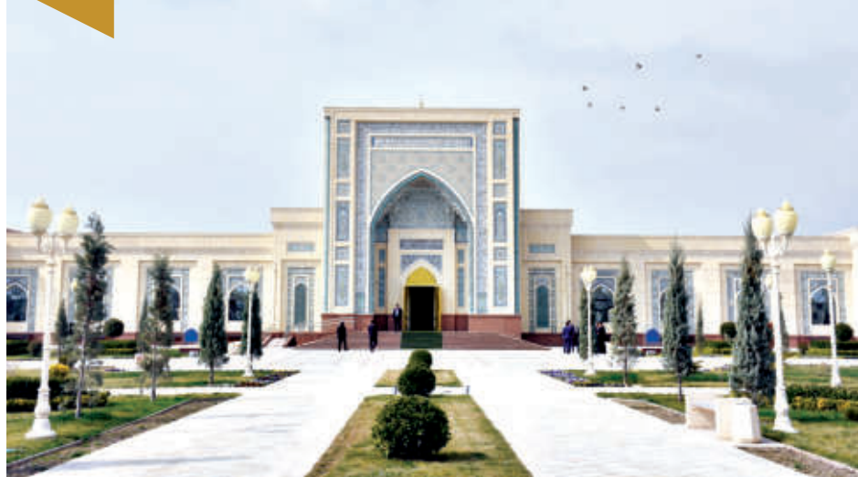
Хамми йўлдошев оғам сурат.