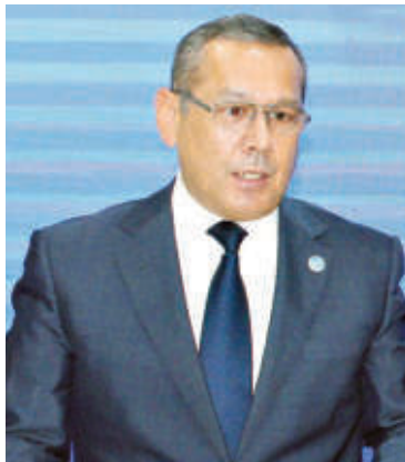
Улуғбек ИНОЯТОВ, Олий Мажлис Қонунчилик палатаси спикери ўринбосари

Эркинлик ва фаровонлик ғояси халқни бирлаштиради, эзгу мақсадларга даъват этади. Президентимизнинг "Ўзбекистон Республикаси давлат мустақиллигининг ўттиз йиллик байрамига тайёргарлик кўриш ва уни юқори савияда ўтказиш тўғрисида"ги қарори билан эркинлик ва фаровон яшаш ғояси шиор сифатида танланганида ҳам чуқур маъно-мазмун муҷассам.